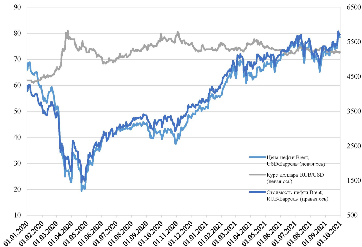
Динамика цены на нефть и курса доллара с 01.01.2020

Экономическая среда оказывает значительное влияние на деятельность и финансовое положение некредитной финансовой организации. Руководство принимает все необходимые меры для обеспечения устойчивости деятельности некредитной финансовой организации. Однако будущие последствия сложившейся экономической ситуации сложно прогнозировать, и текущие ожидания и оценки руководства могут отличаться от фактических результатов.